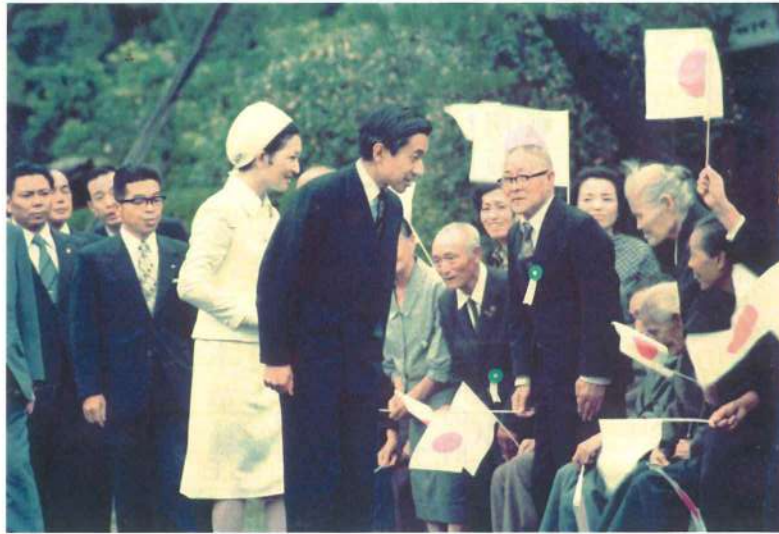
昭和49年 滋賀縣護國神社を参拝された際、ご遺族に親しくお声をお掛けになる 皇太子・同妃殿下時代の今上陛下・皇后陛下